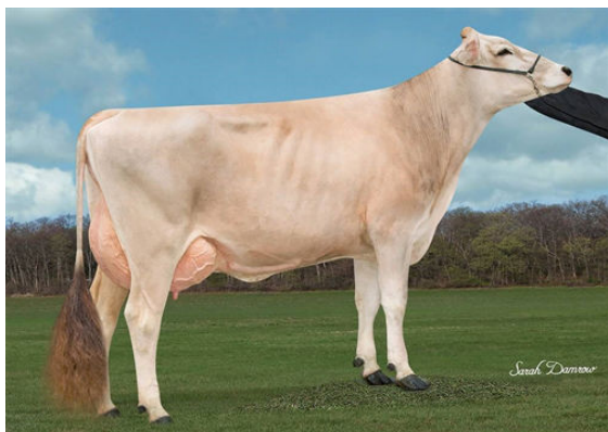
HILLTOP ACRES CAD PAULA GRANDDAM