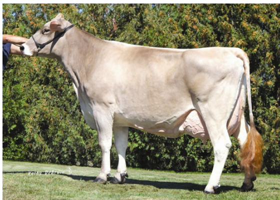
HILLTOP ACRES JOLT DOLL FIFTH DAM